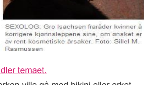
SEXOLOG: Gro Isachsen fraråder kvinner å korrigere kjønnsleppene sine, om ønsket er av rent kosmetiske årsaker.