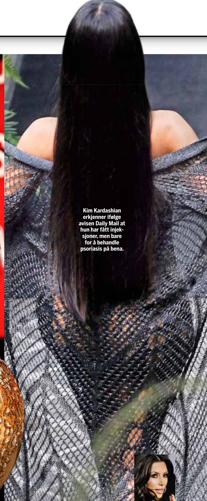
Kim Kardashian erkjenner ifølge avisen Daily Mail at hun har fått injeksjoner, men bare for å behandle psoriasis på bena.